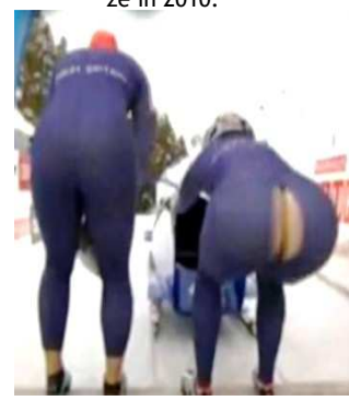
Tijdens Wereldbeker Bobslee in Sankt-Moritz is een deelnemster letterlijk met de billen bloot gegaan.