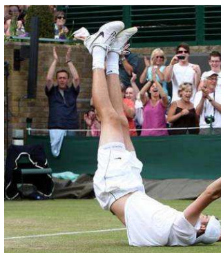
Langste tennismatch ooit op Wimbledon, verspreid over drie dagen en 11u05.