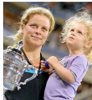
Kim Clijsters verdedigt haar titel op de US Open met succes. Ook de Masters pakte ze in 2010.