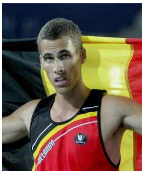
Kevin Borlee pakt goud op het EK atletiek in Barcelona voor België op de 400 meter.

Even terugblikken op het afgelopen jaar. 2010 was een goed jaar voor de sport, want buiten de normale tennis toernooien, voetbal leagues hadden we ook Olympische Winterspelen en het WK voetbal in Zuid-Afrika. Om nog even na te genieten van dit sportjaar heb ik een aantal sportfoto's om te herdenken uitgezocht.